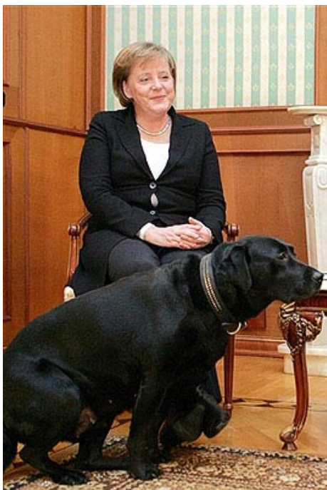
Tapfer lächeln für die Kameras - alles gar nicht so schlimm ...