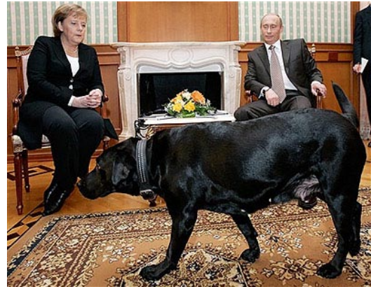
Bitte nicht beißen, scheint die überraschte Kanzlerin zu denken, als das schwarze Tier sich nähert. Dabei wollte Frau Merkel doch gerade über Menschenrechte in Russland reden ...