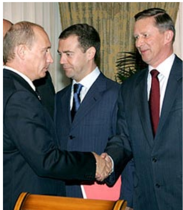
Putin, Medwedew, Iwanow

Es kann sein, dass die russischen Wähler sich ähnlich fühlen wie Agafja Tichonowna, wenn sie die russischen 19-Uhr-Nachrichten gucken und die Berichterstattung über die beiden heißesten Kreml-Kandidaten, Sergei Iwanow und Dimitri Medwedew, verfolgen. Jeden Abend sind beide