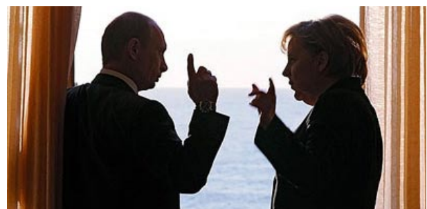
Und denken Sie immer an meinen Hund, Frau Merkel ...!