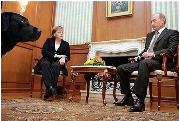
Putins Hündchen schaut vorbei, noch ganz friedlich ...